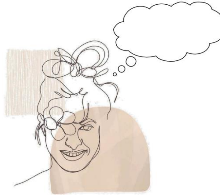
Tania Witte – Einfach nur Paul – Kopiervorlage 8

Amira & Paul. Die beiden lieben sich, allerdings auf unterschiedliche Art und Weise. Amira spricht offen von ihren Empfindungen, wir kennen allerdings nur Pauls Gedanken. Was geht Amira durch den Kopf als sie Paul nach diesem Tag verlässt? Verfasse einen inneren Monolog, der sich um Amiras Gedanken zu ihren Gefühlen zu Paul dreht.