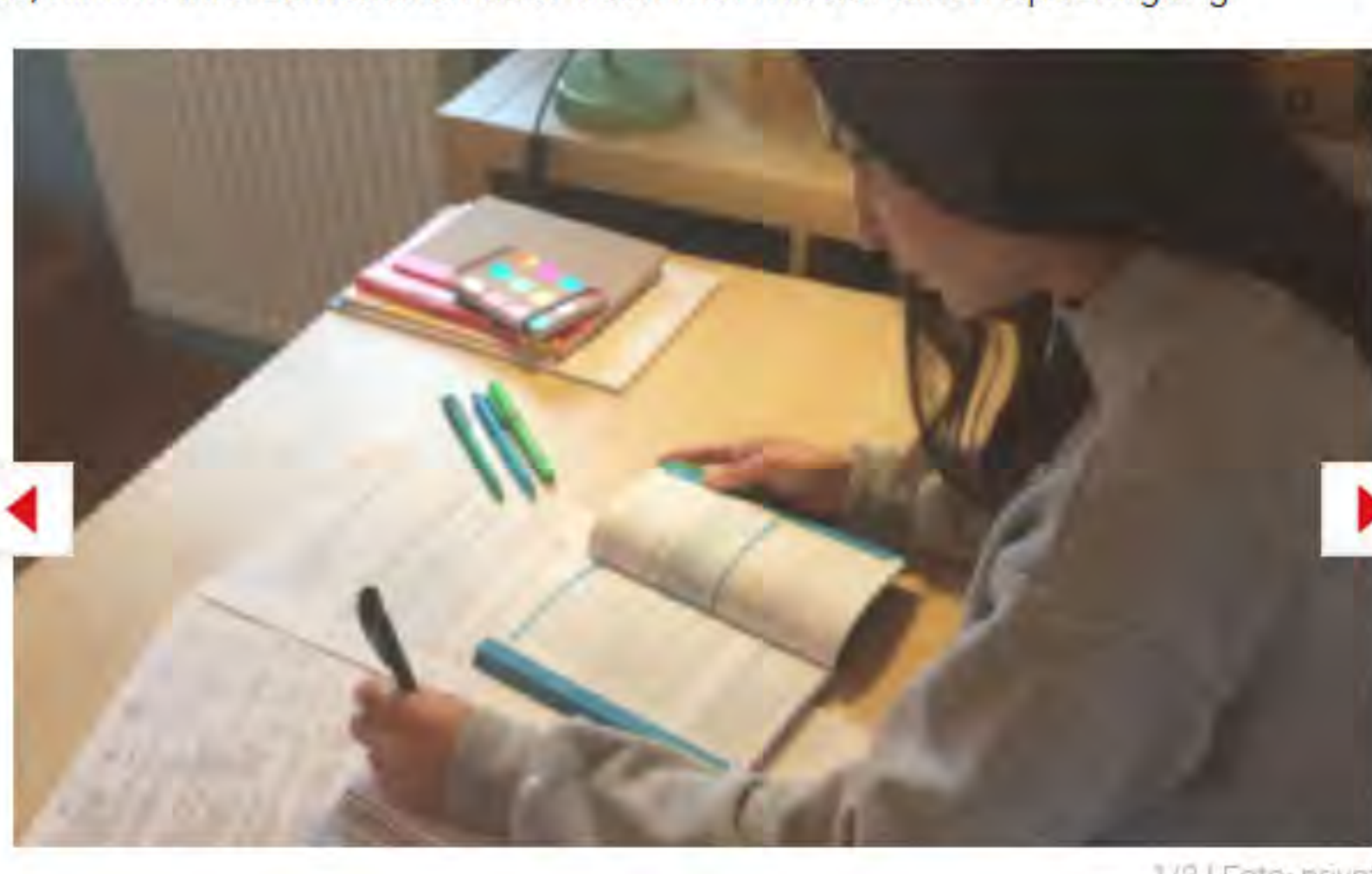
1/3 | Foto: privat

"Um konzentrierter zu sein und mich nicht so leicht ablenken zu lassen, lerne ich eher alleine. Wenn ich eine Frage habe, schreibe ich meinen Freunden eine Nachricht und wir versuchen gemeinsam, eine Lösung zu finden. Ich verwende viele verschiedene Lehrbücher zum Lernen – oft verwende ich auch Lern-Apps, die zu meinem Stoff passen. Aus der "Fit fürs Abi Express"-Reihe habe ich die Bände Englisch sowie Politik und