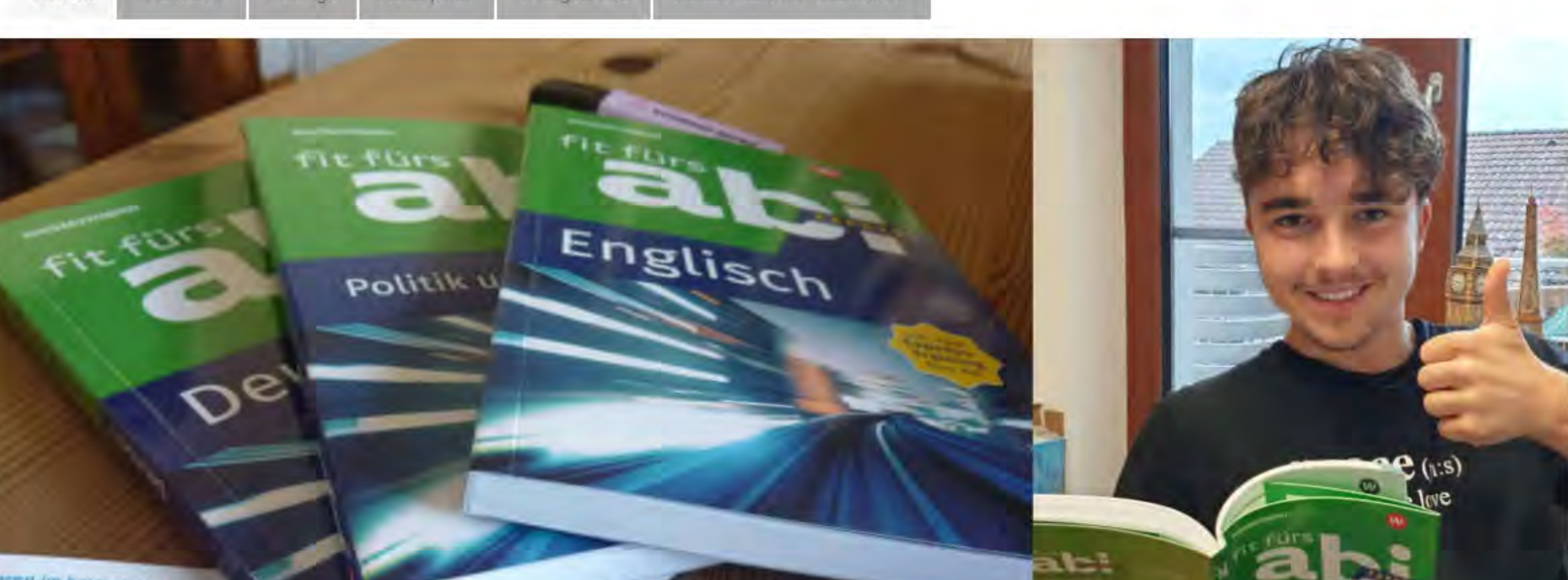
Der Westermann Lerntest zeigt, wie die "Fit fürs Abi Express"-Bücher bei den UNICUM ABI Lesern abschneiden.

Ansicht Bearbeiten Beiträge Nodequeue Voting results Admin-Elemente ausblenden