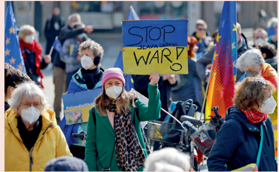
„Pulse of Europe“-Kundgebung in Köln 2022