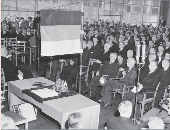
Unterzeichnung des Grundgesetzes am 23. Mai 1949