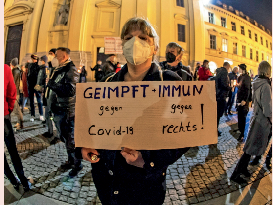
Protest-Spaziergang in München, 2022