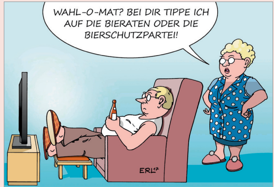
Karikatur Wahl-O-Mat III von Erl, 2017