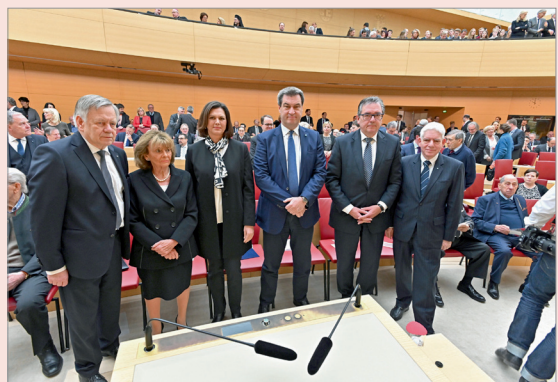
Landtagsplenum Bayern: 23.01.2019 – Gedenkakt für die Opfer des Nationalsozialismus