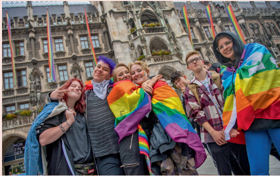
Christopher-Street-Day in München 2021