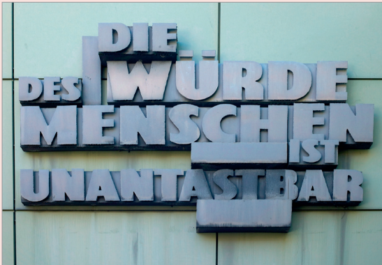
Inschrift am Landgericht in Frankfurt am Main