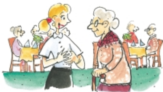
Betreuung von Senioren

Dienstleister in der Hauswirtschaft müssen ganz verschiedene Kunden betreuen können. Dafür wird eine Vielzahl von Kompetenzen benötigt, wie z. B. Übersicht, Hilfsbereitschaft, Freundlichkeit, Ehrlichkeit, Offenheit, Toleranz, Rücksichtnahme . Ferner sind gute Umgangsformen, die der jeweiligen Situation immer angepasst werden müssen, nötig.