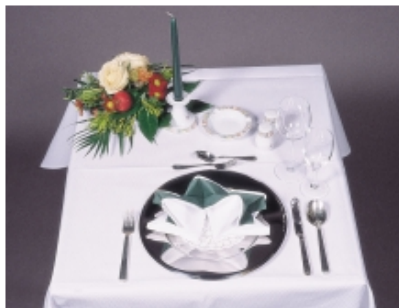
Grundgedeck Mittagessen 3-Gang-Menü