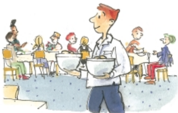
Arbeiten in einer Jugendherberge

Gute Umgangsformen werden von der Erziehung beeinflusst und sind Grundvoraussetzung für gute Dienstleistungen. Aber sie müssen auch am Arbeitsplatz trainiert und kontrolliert werden.