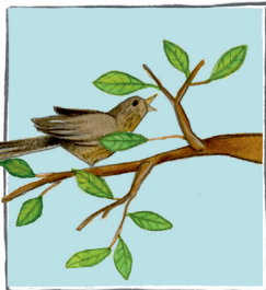
Amsel Tilli ist am Ast.