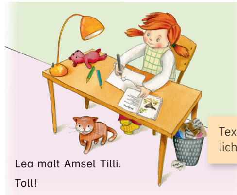
Lea malt Amsel Tilli. Toll!

Texte auf unterschiedlichen Niveaustufen