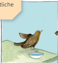
Ist Tilli satt?