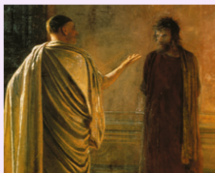
Nikolai Nikolajewitsch Ge (1831-1894): Was ist Wahrheit?, 1890

Wahrheit kann unterschiedlich definiert werden. Nach der „Korrespondenztheorie“ sind Aussagen dann wahr, wenn sie mit der Wirklichkeit übereinstimmen. Doch kann man damit die Menschenwürde als „wahr“ begründen? Nach der „Kohärenztheorie“ entscheidet sich die Wahrheit einer Aussage daran, ob sie mit einer allgemein akzeptierten Theorie, wie z.B. der Evolutionstheorie zusammenpasst. Doch übergeordnete Theorien können sich als falsch erweisen. Nach der „Konsensstheorie“ gilt das als wahr, worüber in einem herrschaftsfreien Diskurs mit einleuchtenden Argumenten ein Konsens erreicht wurde, z.B. bei der Verabschiedung des Grundgesetzes. Nach der „pragmatischen Theorie der Wahrheit“ gilt als wahr, was für Menschen die beste Orientierung in ihrer jeweiligen Lebenswirklichkeit bietet. Die Frage nach der Wahrheit stellt sich aber noch einmal anders dar, wenn jemand nach der Aussage „Ich stehe zu dir.“ gefragt wird: „Ist das wahr?“ Dann kommen Glaubwürdigkeit und Verlässlichkeit ins Spiel.