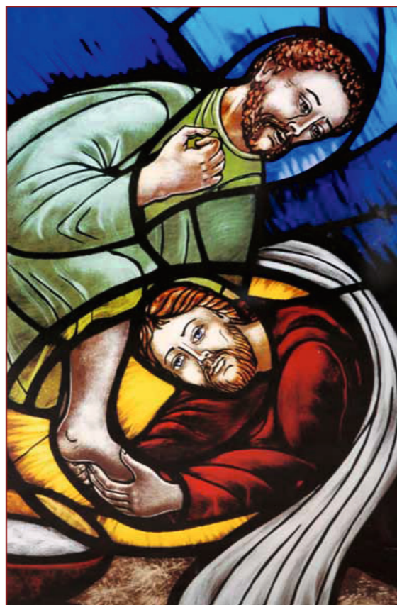
Fußwaschung, Santa Croce, Florenz, 13. Jahrhundert