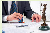
Handlungsvollmacht und Procura