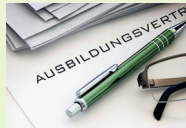
Rechte und Pflichten