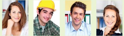
Auszubildende der ModernOffice KG